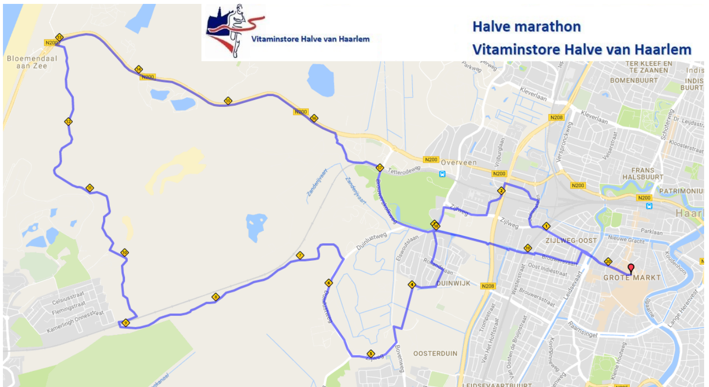
Halve marathon Vitaminstore Halve van Haarlem